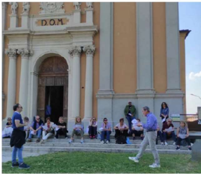
7 MAGGIO - DA MANTOVA A SAN MARTINO DALL'ARGINE TRA STORIA E NATURA