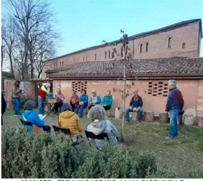
18 MARZO - TREKKING URBANO. LA VIA CAROLINGIA E SANT'ANSELMO DA BAGGIO