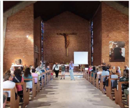
24 SETTEMBRE - IL QUARTIERE DI TE BRUNETTI, LA STORIA DI UNA COMUNITÀ