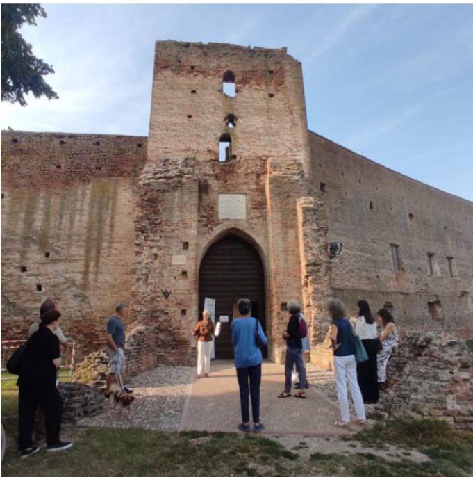
17 SETTEMBRE - CASTEL D'ARIO. IL CASTELLO DELLE VENDETTA