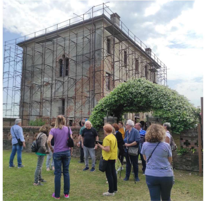
28 MAGGIO - LUNGO IL GRANDE FIUME, ALLA SCOPERTA DELLE ANTICHE CORTI DELLA CAMPAGNA MANTOVANA