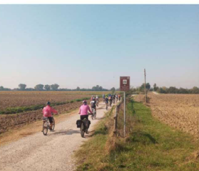
1 OTTOBRE - 15 ANNI DI PATRIMONIO MONDIALE UNESCO CICLOTOUR - LE CITTÀ FORTEZZA.