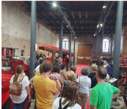
17 SETTEMBRE - LE SCUDERIE DEI GONZAGA