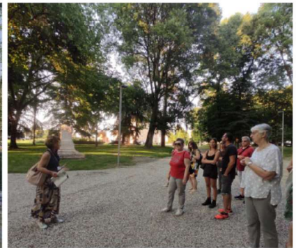
11 GIUGNO - MANTOVA C'ERA UNA VOLTA L'ACQUA, SUL FAR DELLA SERA