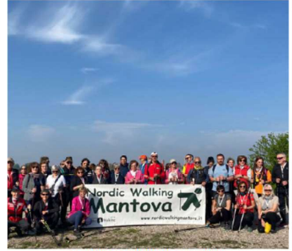
23 APRILE - CAMMINANDO ATTORNO AI LAGHI DI MANTOVA TRA FLORA E FAUNA