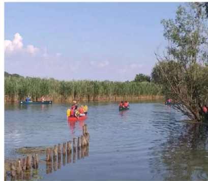
14 MAGGIO - TEMPI LENTI SULL'ACQUA. LA VIA CAROLINGIA IN CANOA CANADESE DA RIVALTA A MANTOVA