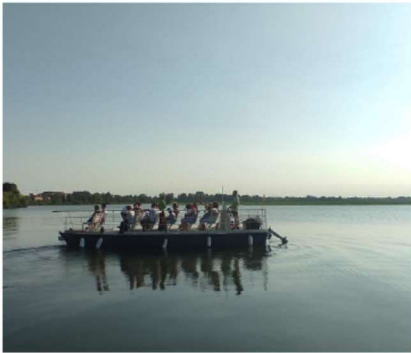
30 GIUGNO - IN BARCA TRA AIRONI E FIOR DI LOTO