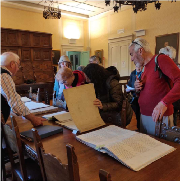
16 APRILE - SULLE TRACCE DELLA COMUNITÀ EBRAICA DI BOZZOLO