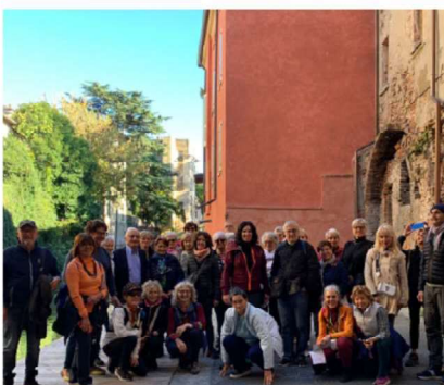
31 OTTOBRE - PER PONTI, PORTI E PORTONI... XX GIORNATA NAZIONALE DEL TREKKING URBANO