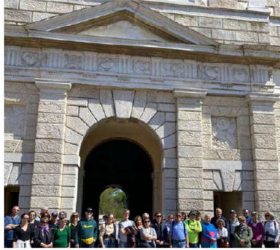
16 APRILE - MANTOVA FORTIFICATA