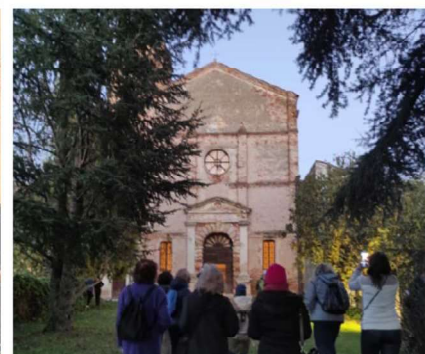
5 NOVEMBRE - MANTOVA E GAZZUOLO, TRA OPERE IDRAULICHE E SEGNI DEL POTERE GONZAGHESCO